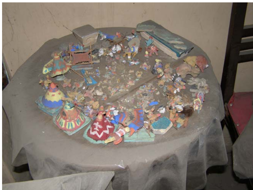
Fig. 2 – Macheta unui sat al indienilor din Preeriile Nordice, lut nears, tempera, lemn, pânză, piele, colecția A.S. Ionescu.