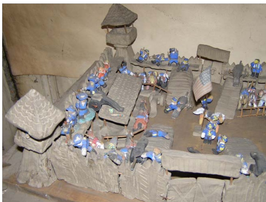
Fig. 3 – Macheta unui fort militar din Preeriile Nordice, lut nears, tempera, lemn, pânză, piele, metal, colecția A.S. Ionescu.