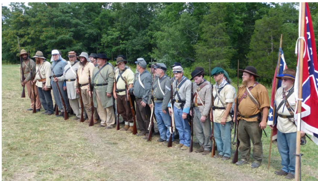
Fig. 9 – Trupe ale Confederației Sudiste purtând uniforme gri, reconstituire a bătăliei de la Gettysburg, 1 iulie 2013, fotograf necunoscut, colecția A.S. Ionescu.