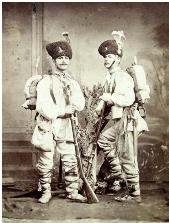
Fig. 2 – Carol Pop de Szathmari, Dorobanți, 1878, Biblioteca Academiei Române.