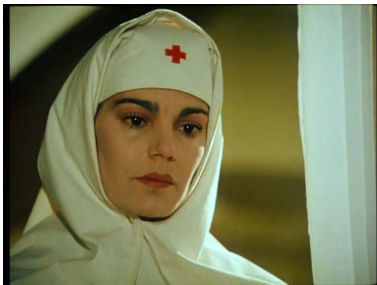
Fig. 29 – Maia Morgenstern în rolul reginei Maria, imagine din filmul Triunghiul morții , 1999.