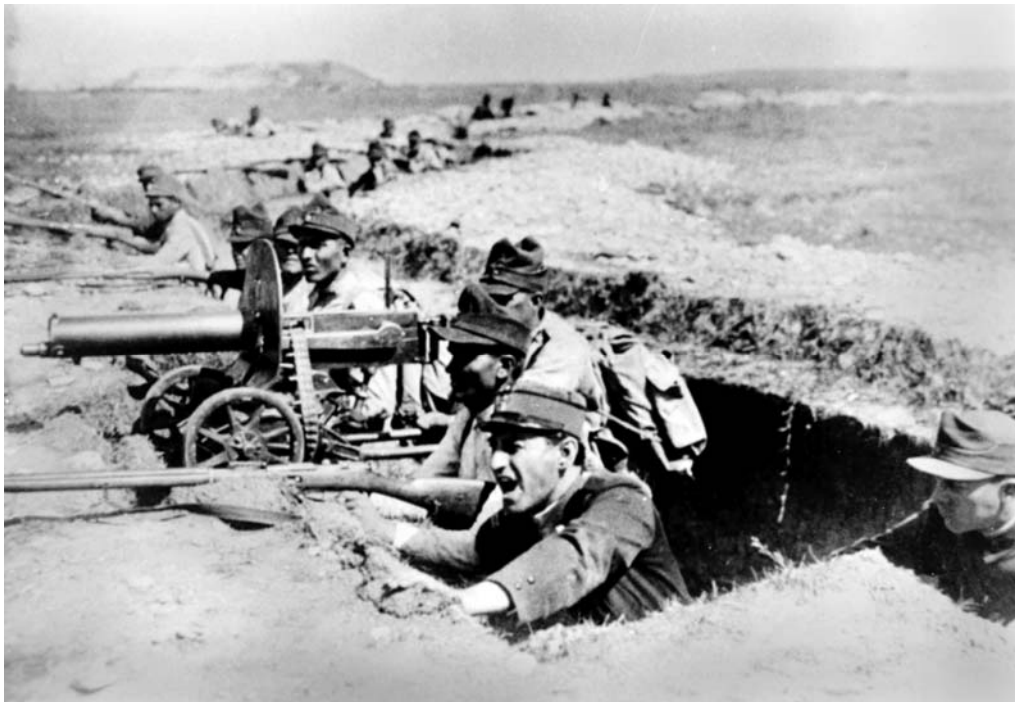
Fig. 17 – Militari în tranșee, imagine din filmul Ecaterina Teodoroiu , 1930 – de remarcat chipiul moale și scund al locotenentului și capelele soldaților, mult diferite de acelea purtate de trupe în 1916–1918.