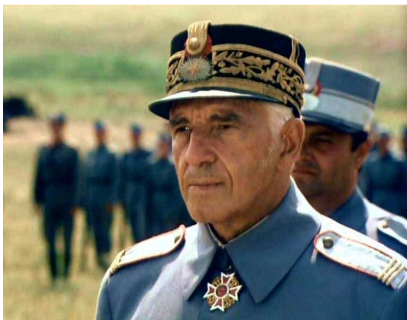
Fig. 26 – Sergiu Nicolaescu în rolul generalului Averescu, imagine din filmul Triunghiul morții , 1999.