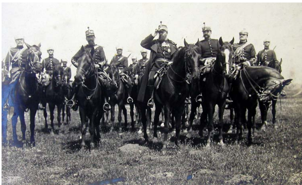
Fig. 1 – Principele Carol I și statul său major pe front, imagine din filmul Independența României , 1912, Biblioteca Academiei Române.