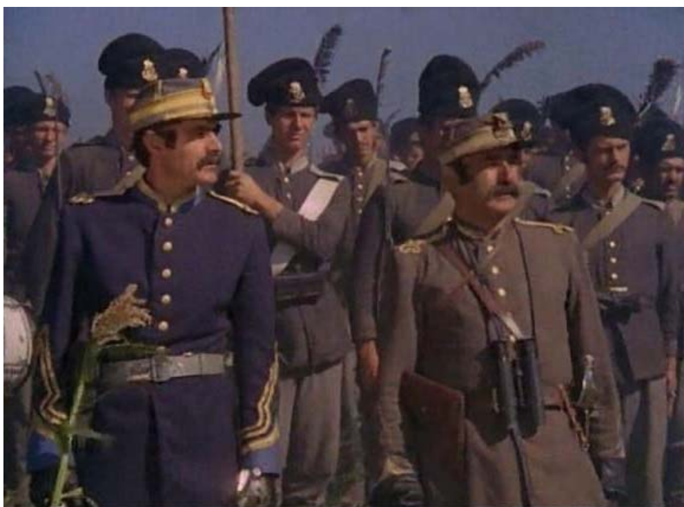
Fig. 8 – Revista trupelor, imagine din filmul Pentru patrie , 1977 – de remarcat amestecul de uniforme de culoare gri și de culoare bleumarin, chipiele fără pampon și centiroanele din piele gri.