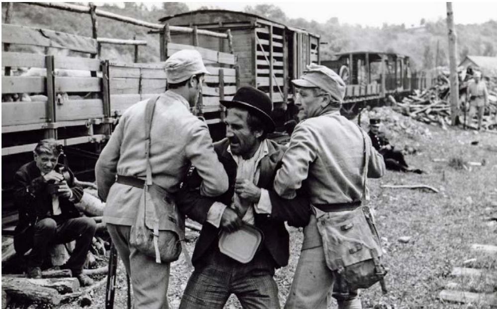
Fig. 24 – Imagine din filmul Prin cenușa imperiului , 1978 – de remarcat traistele de merinde din dotarea armatei române socialiste.