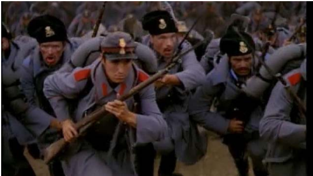
Fig. 11 – Trupele românești la atac, imagine din filmul Pentru patrie , 1977.