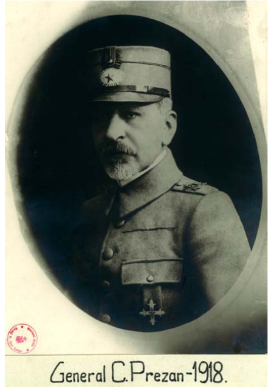
Fig. 36 – Generalul Constantin Prezan.