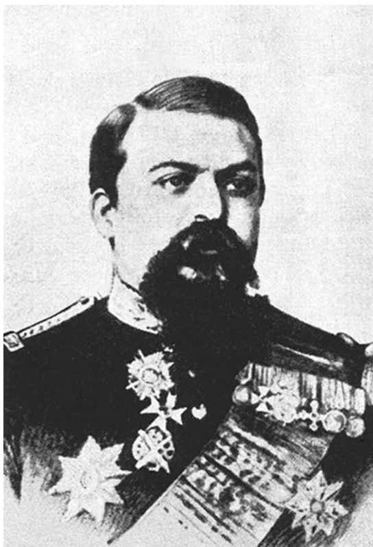
Fig. 12 – Generalul de divizie Alexandru Cernat, comandantul Armatei române de operațiuni.