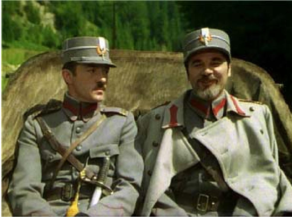
Fig. 23 – Imagine din filmul Ultima noapte de dragoste , 1980 – de remarcat sabia de model austriac, dar cu dragon de model franțuzesc.