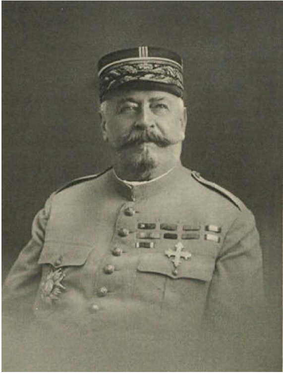
Fig. 35 – Generalul Henri Mathias Berthelot