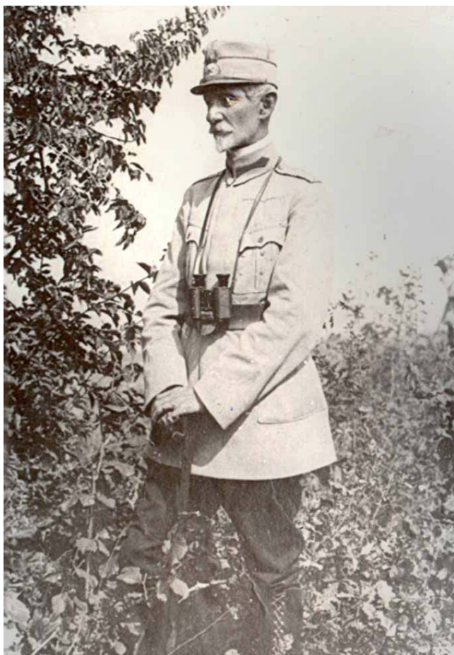
Fig. 25 – Generalul Alexandru Averescu, Biblioteca Academiei Române.