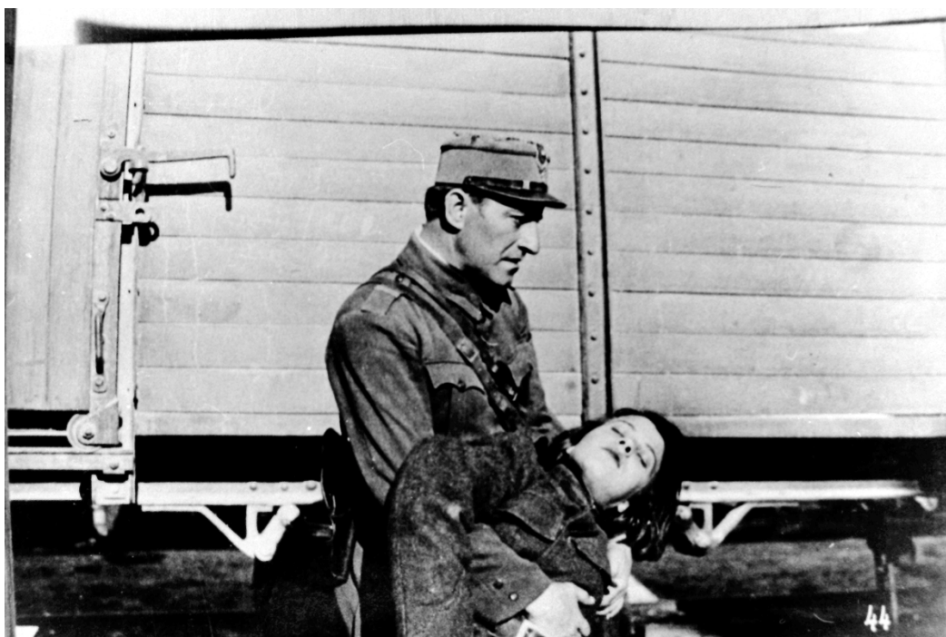
Fig. 18 – Imagine din filmul Ecaterina Teodoroiu , 1930.