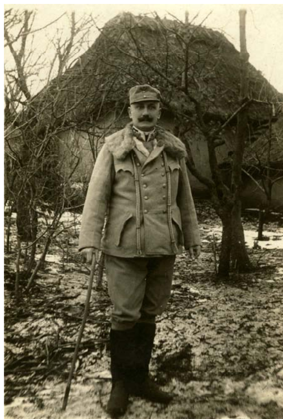
Fig. 47 – Colonel austro-ungar în ținută de campanie, de iarnă, 1917, colecția A.S. Ionescu.