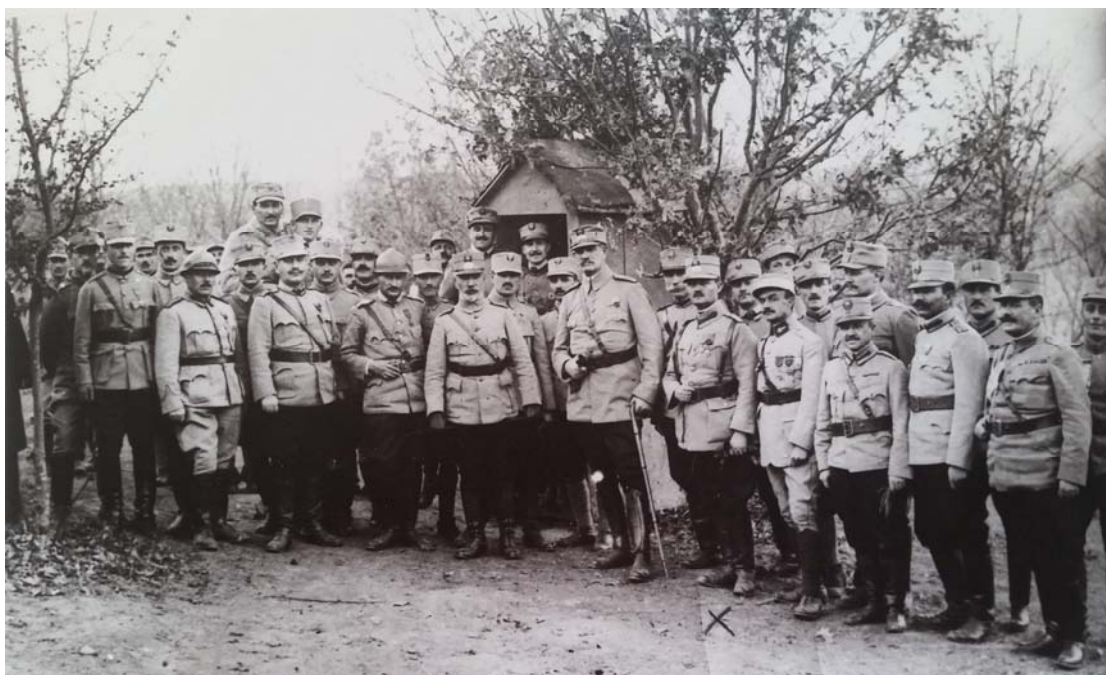
Fig. 19 – Serviciul Fotografic al Armatei, Vizită la Divizia a X-a a generalului Constantin Iancovescu, ministru de război (cu baston, în mijloc) încadrat de generalii Nicolae Petala și Henri Cihoschi, comandantul Diviziei a X-a alături de maiorul francez de stat major Dubois Fleury, 1917, colecție particulară.