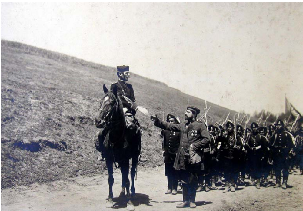
Fig. 3 – Regiment de dorobanți în marș, imagine din filmul Independența României , 1912, Biblioteca Academiei Române – de remarcat uniformele din postav civit și căciulile de forma „țurcană” purtate de dorobanți.