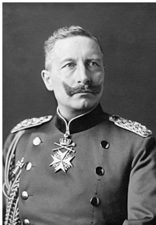
Fig. 31 – Kaiserul Wilhelm al II-lea, carte poștală, 1902.