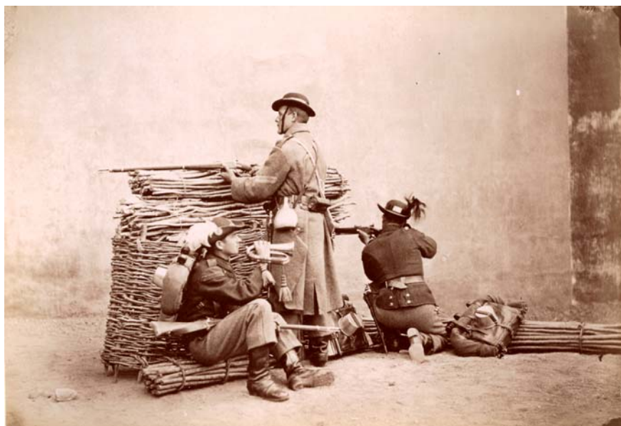
Fig. 15 – Franz Duschek, Vânători pedestri în poziție de tragere, Biblioteca Academiei Române – de remarcat ranițele militarilor și puștile Peabody.