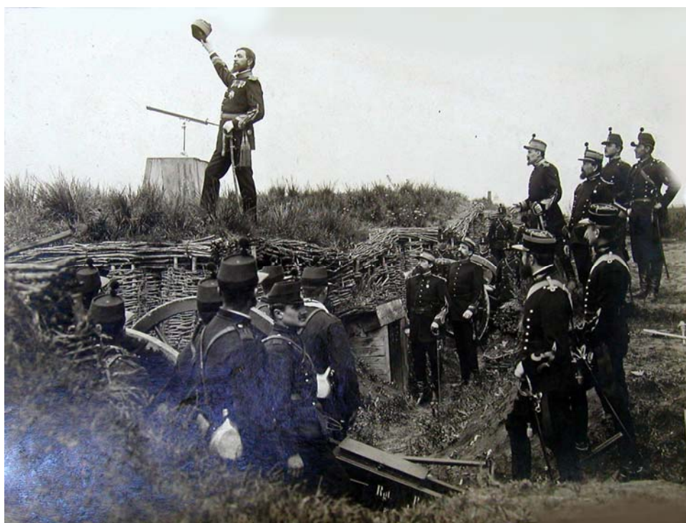
Fig. 6 – „Asta e muzica ce-mi place!”, imagine din filmul Independența României , 1912, Biblioteca Academiei Române – de remarcat chipiele cilindrice purtate de ofițeri.