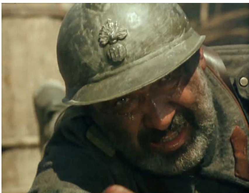
Fig. 43 – Imagine din filmul Triunghiul morții , 1999 – de remarcat stema franceză de pe casca infanteristului român.