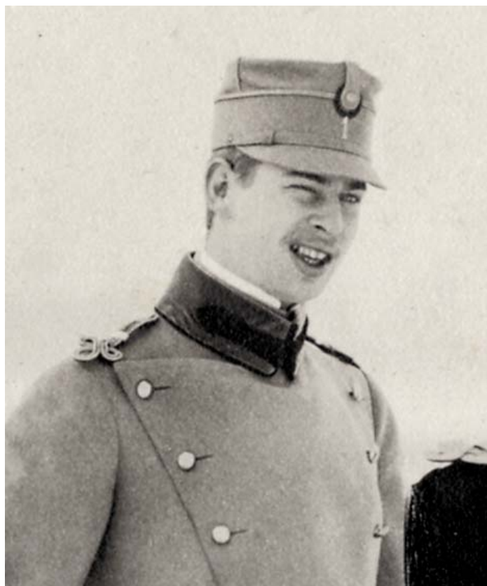
Fig. 38 – Principele Carol (detaliu), Biblioteca Academiei Române.