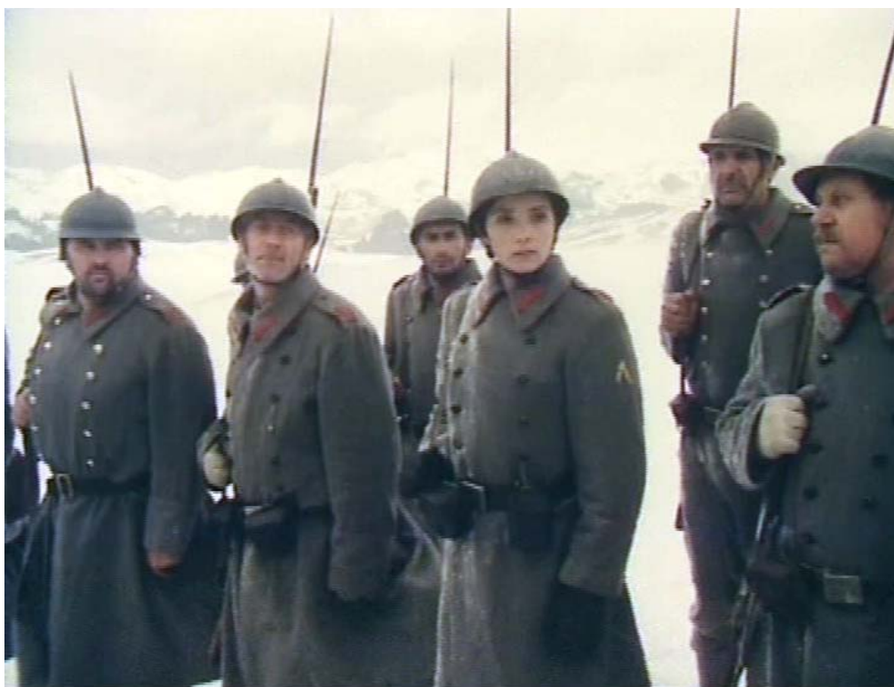
Fig. 20 – Imagine din filmul Ecaterina Teodoroiu , 1978.