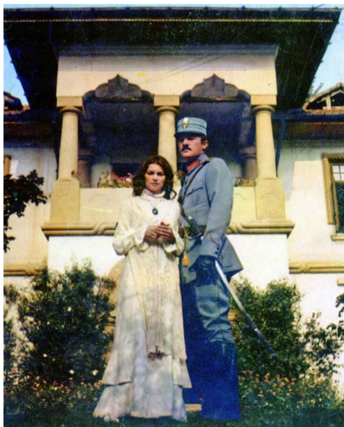
Fig. 22 – Imagine din filmul Ultima noapte de dragoste , 1980.