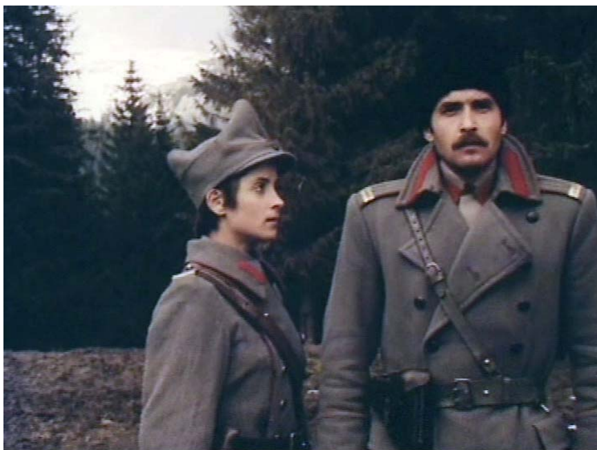
Fig. 21 – Imagine din filmul Ecaterina Teodoroiu , 1978.