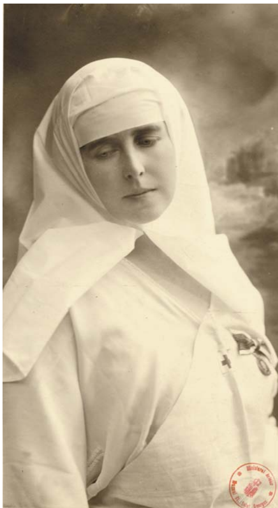
Fig. 30 – Regina Maria în timpul campaniei, Biblioteca Academiei Române.