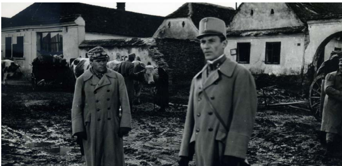
Fig. 44 – Liviu Ciulei (căpitanul Klapka) și Victor Rebengiuc (locotenentul Apostol Bologa), imagine din filmul Pădurea spânzuraților , 1965, Colecția Arhivei Naționale de Filme (ANF).