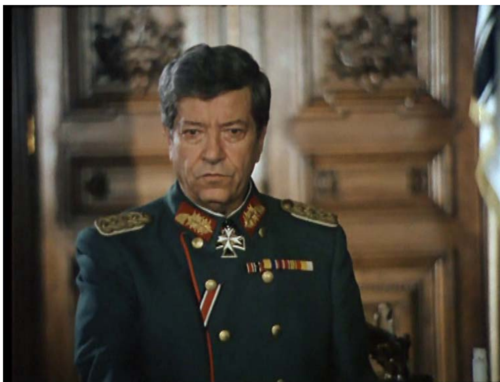
Fig. 32 – Ion Dichiseanu în rolul kaiserului Wilhelm al II-lea, imagine din filmul Triunghiul morții , 1999.