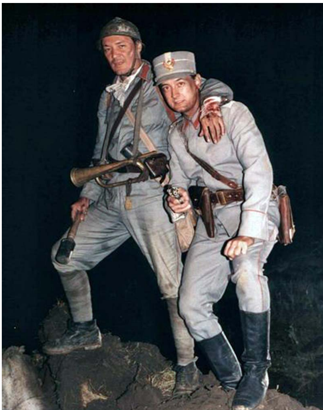
Fig. 42 – Imagine din filmul Triunghiul morții , 1999 – de remarcat revolverul din mâna ofițerului ce nu se potrivea cu tocul de piele în care trebuia purtat; de asemenea, de remarcat dragonul de sabie atârnat de trompeta gornistului.