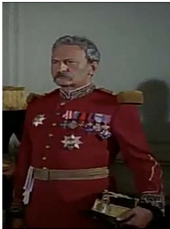
Fig. 13 – Amza Pellea în rolul generalului Alexandru Cernat, imagine din filmul Pentru patrie , 1977.