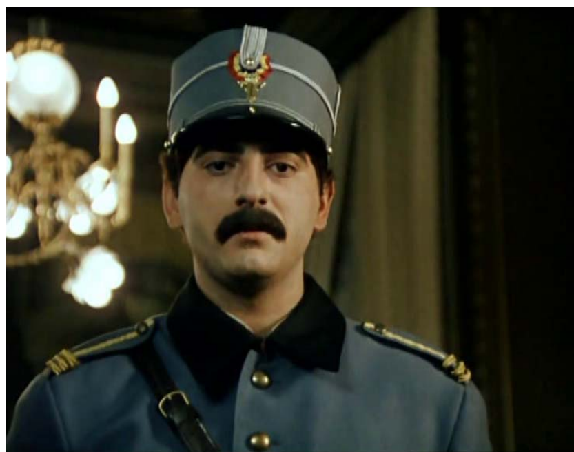
Fig. 39 – Ovidiu Niculescu în rolul principelui Carol, imagine din filmul Triunghiul morții , 1999.