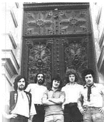
Fig. 2 – Formația Phoenix în 1972–1973.